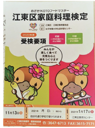
自治体独自の設問ができる 江東区家庭料理検定

久喜市は、新型コロナウイルス感染症の影響を受けた市内事業者と地域経済の活性化を図るため、前回と同様、%プレミアムになる「令和3年度コロナに負けるな！久喜市プレミアム付き商品券」を販売します。