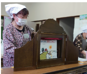
調理後、紙芝居を披露するボランティア (子ども食堂 めくもり)

久喜市の子ども食堂は、驚宮団地で久喜青年会議所が、最初に開設し、久喜市内では、子ども食堂が3箇所、フードパントリーが3箇所になりました。現在では、子ども食堂が一回128食、フードパントリーの利用世帯は、90世帯に